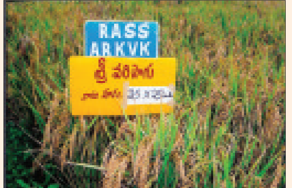
కృషి విజ్ఞాన కేంద్రం వారి ప్రదర్శనా క్షేత్రంలో విరగ కాసిన 'శ్రీ' వరి పైరు

జవాబు : లేత నారు నాటేటప్పుడు మంచి ఆరోగ్యకరమైన కర్రను నాటితే చనిపోవడమంటూ జరగదు. కూలీలు అక్కడక్కడా బలహీనమైన కర్రలను నాటడం సహజం. ఇవి చనిపోవడంతో ఏర్పడిన ఖాళీలలో నాటకుండా మిగిలివున్న నారుని ఈ ఖాళీలలో నాటుకొని దిగుబడి తగ్గకుండా చూసుకొనవచ్చును.