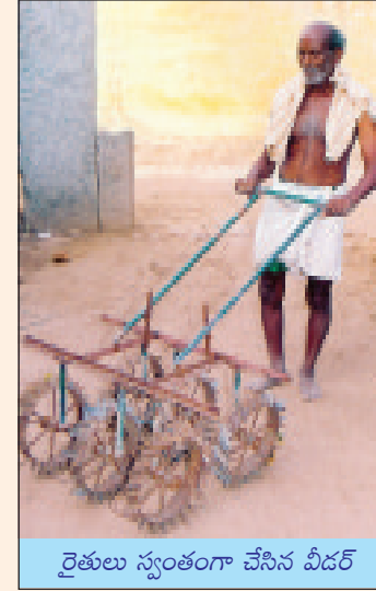
రైతులు స్వంతంగా చేసిన వీడర్

గాకుండా, వరుసల మధ్య అది తిరగడంవలన వేర్ల చుట్టూ ఉన్న భూమి కదిలి, వేర్లకు ఆక్సిజన్ బాగా అందుతుంది. తద్వారా సూక్ష్మజీవుల చర్య వేగవంతమై భూమిలోని సారము వేర్లు బాగా అందుకొని ఎక్కువగా పిలకలు వేయడానికి దోహదపడుతుంది. కాబట్టి పొలంలో కలుపు సమస్య తక్కువున్నా కూడా రోటరీ వీడర్ను తప్పనిసరిగా వరుసలమధ్య నడిపించాలి. రోటరీవీడర్ను నడిపించే ముందు రోజు పొలంలో పలుచగా