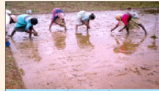
మార్కర్ సాయంతో గీసిన గీతలలో నారు నాటడం

చిరుపొట్ట దశవరకూ పొలంలో నీరు నిలువ వుండరాదు. కేవలం భూమి తడిగా వుంటే సరిపోతుంది. సాధారణంగా వరి పండించే రైతాంగం పొలంలో ఎప్పుడూ నీరు వుంటేనే అధిక దిగుబడిని సాధిస్తామని అపోహ పడుతారు. వరి నీటిలో బతుకుతుండేగాని నీటిమొక్క కాదు. పొలంలో నీరు నిల్వ ఉన్నప్పుడు వరి వేళ్ళలో గాలి సంచులు తయారుచేయడానికి ఎక్కువ శక్తిని వినియోగించుకుంటుంది. కాబట్టి వరి పొలంలో నీరు నిల్వ ఉంచకుండా తడిగా బురద పదునులో వుంచుకోవడం వలన వేరు వ్యవస్థ బాగా వృద్ధి చెంది ఎక్కువ పిలకలు పెట్టి అధిక దిగుబడి రావడానికి ఉపయోగ పడుతుంది. ఈ పద్ధతిలో పైరు చిరుపొట్ట దశవరకూ 2-3