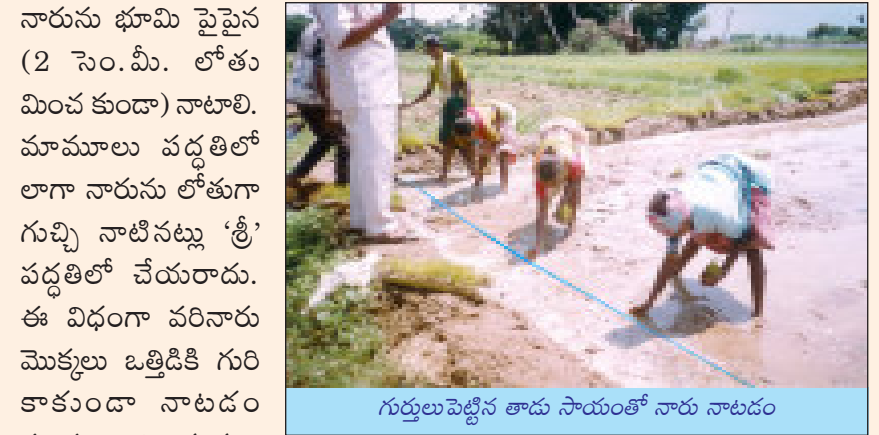
గుర్తులుపెట్టిన తాడు సాయంతో నారు నాటడం

10. పొలంలో నాటే పద్ధతి: నాటడానికి వచ్చిన కూలీలు తమ తమ చేతుల్లో పట్టేటంత నారును మట్టితోపాటు పళ్ళాలనుండి తీసుకొని గుర్తులు పెట్టిన చోట ఒక్కో కర్రను గింజ, బురదతో సహా నాటాలి. మార్కరు లాగి గీతలు గీసిన పొలంలో అయితే రెండు గీతలు కలిసే చోట ఒక్కో కర్రను నాటాలి. 'శ్రీ' పద్ధతిలో వీలైనంతవరకూ