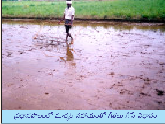
ప్రధానపొలంలో మార్కర్ సహాయంతో గీతలు గీసే విధానం

గుర్తులు పెట్టాలి. పొలంలో పట్టుకొని రంగు దారాల ముడులు ఉన్నచోట కూలీలను ఒక్కో కర్ర పెట్టమనాలి. ఒక లైన్ నాటడం మార్తయిన తర్వాత 25 సెం.మీ. ఎడంతో నైలాన్ తాడును ముందుకు జరపాలి. ఈ విధంగా ప్రతి 25 సెం.మీ. దూరంతో