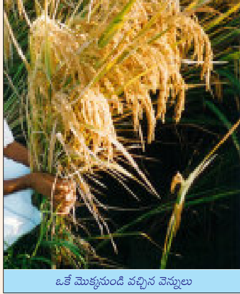
ఒకే మొక్కనుండి వచ్చిన వెన్నులు

వెన్నులూ ఒకేసారి వచ్చి పొడువుగా వుండి, బరువైన గింజలను కలిగి వుంటాయి. రాస్-ఆచార్య రంగా కృషి విజ్ఞాన కేంద్రం వారు ఖరీఫ్-2004లో జరిపిన ప్రయోగాత్మక ప్రదర్శనా క్షేత్రాలలో ఒక ఎకరా నుండి 50 బస్తాల (ఒక్కో బస్తా 75 కిలోలు) దిగుబడిని రికార్డు చేయడం జరిగినది. ఆంధ్రప్రదేశ్ లో వివిధ ప్రాంతాలలో వ్యవసాయ యూనివర్సిటీ వారు జరిపిన ప్రదర్శనా క్షేత్రాల వివరాలను గమనిస్తే 'శ్రీ' సేద్యం 'సిరులు' కురిపించే సేద్యమని రైతులకు అర్థమవుతుంది.