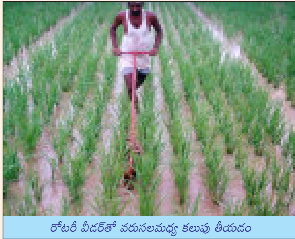
రోటరీ వీడర్తో వరుసలమధ్య కలుపు తీయడం

మొక్కలు నేలలోనే కలిసిపోయి అవికూడా పచ్చిరొట్ట ఎరువులాగా సత్తువనిస్తాయి. ప్రతీ సారీ ఈ వీడర్ను నడపడంవలన ఎకరాకు సుమారు 400 కిలోల పచ్చిరొట్ట భూమికి చేకూరుతుంది. రోటరీ వీడర్ను నడపడంవలన కలుపును నివారించడమే