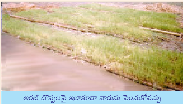
అరటి దొప్పలపై ఇలాకూడా నారును పెంచుకోవచ్చు

భూమిని మెత్తగా దున్ని / దమ్ము చేసి ఎత్తుగా వుండేటట్లు తయారు చేసుకొని చుట్టూ కాలువ తీయాలి. తడిమట్టి జారిపోకుండా నారుమడి చుట్టూ చెక్కలతోగాని, కొబ్బరిమట్టలతోగాని, వెదురుబొంగులతోగాని ఊతం ఏర్పాటు చేసుకోవాలి. నారుమడి తయారు చేసుకున్న తర్వాత మడిపై బాగా చివికిన మెత్తటి పశువుల ఎరువును లేక వర్మికంపోస్టును పలుచని పొరగా అర అంగుళం మందాన