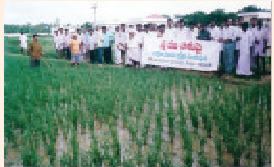
కృషి విజ్ఞాన కేంద్రంలోని శ్రీ ప్రదర్శనా క్షేత్రాన్ని సందర్శించిన గుర్రంకొండ మండల రైతులు