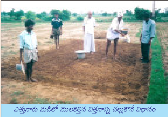
ఎత్తునారు మడిలో మొలకెత్తిన విత్తనాన్ని చల్లుకొనే విధానం

6. నారు పోసే విధానం : ఒక ఎకరా పొలంలో నాటేందుకు ఒక సెంటు నారుమడిలో పెంచిన నారు సరిపోతుంది. 2 కిలోల వరి విత్తనాన్ని 1 సెంటు నారుమడిలో చల్లుకోవాలి. 'శ్రీ' పద్ధతిలో నారుపోయడానికి ఎత్తైన చిన్న చిన్న మడులను (మిరపనారు మళ్ళు లాగా) తయారు చేసుకోవాలి. ఈ నారు మడులను ప్రధాన పొలంలోని అడుసులో నైనా లేక పొలం బయట మెట్టలోనైనా తయారు చేసుకొనవచ్చును.