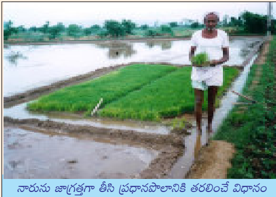
నారును జాగ్రత్తగా తీసి ప్రధానపొలానికి తరలించే విధానం

9. నారు తీసే విధానం : 'శ్రీ' పద్ధతిలో 8-12 రోజుల వయసు కల్గిన లేతనారు నాటడం వలన నారును చాలా జాగ్రత్తగా మడినుంచి వేరుచేయాలి. సాంప్రదాయ పద్ధతిలో లాగా ఇక్కడ నారు పెరకడం, కట్టలు కట్టడం వంటివి చేయకూడదు. 8-12 రోజుల వయస్సులో నారు 2 ఆకులు కలిగి 10-12 సెం.మీ. పొడు వుండి, గింజ మరియు వేర్లను కలిగివుంటుంది. కాబట్టి నారును తీసేటప్పుడు చాలా జాగ్రత్తగా గింజ మరియు