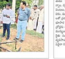
క్రీడ విద్యార్థులకు రైతులకు అభిమానం (ఫోటో)