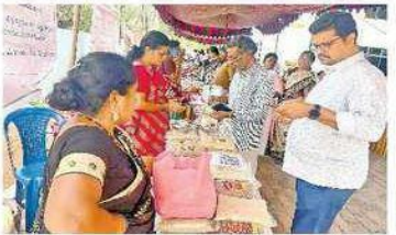
చిరుధాన్యాల కొనుగోలు చేస్తున్న వినియోగదారులు