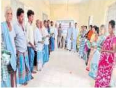
విశ్వంలో రైతులకు భూసార పరిశోధన పట్టణం పంపిణీ