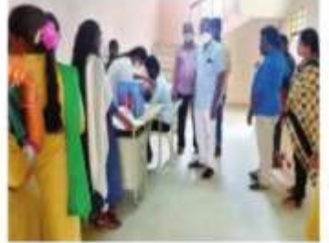
విద్యార్థులకు వ్యాక్సిన్ వేస్తున్న వైద్య సిఫ్టుంది వ్యవసాయ పాలిటెక్నిక్ కళాశాల విద్యార్థిని విద్యార్థులు ఉపాధ్యాయులు పాల్గొన్నారు.

రేణిగుంటజనవరి 7 (వ్రాసాన్): రాష్ట్ర కృషి విజ్ఞాన కేంద్రం వ్యవసాయ పాలిటెక్నిక్ కళాశాల విద్యార్థులకు వ్యాక్సిన్ డ్రైవ్ ను ఆ కేంద్రం సీనియర్ కార్యదేక్షి హెచ్. రాజ్ కృషి వాసులు ఆధ్వర్యంలో నిర్వహించారు. ఈ కార్యక్రమంలో కళాశాలలోని 40 మంది విద్యార్థిని విద్యార్థులకు ఉపాధ్యాయులు కూలతుకోవడం మొదటి రెండు డోసులు వేశారు. రోనా మూడవదశ ఉగ్ర రూపం దాల్చి అవకాశం ఉంది వైద్య సిఫ్టులు కేంద్ర ప్రభుత్వం చేస్తున్న సేవల్లో ప్రతి ఒక్కరు తప్పనిసరిగా రోనా వ్యాక్సిన్ వేసుకుని ఆరోగ్యవైకాపాను అనుభవించుకోవాలని రాష్ట్ర శ్రీనివాసులు తెలిపారు. ఈ కార్యక్రమంలో కేవల శాస్త్రవేత్తలు