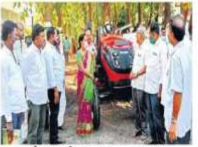
శ్రీకాళహస్తిలో వ్యవసాయ యంత్రాల ప్రదర్శన

శ్రీకాళహస్తి, జనవరి 11: ఆధునిక వ్యవసాయ పరిజ్ఞానంపై రైతులు అవగాహన పెంచుకోవాలని జిల్లా సంయుక్త వ్యవసాయ సంఠాలకుల డివిజన్ అధ్యక్షుడు వడ్లదిగ్గి కార్యాలయంలో మంగళవారం శ్రీకాళహస్తి వ్యవసాయ నేతపిఠాచే పరిశీలించి వ్యవసాయ పరిశాల గ్రాఫులు, రైతులు, రైతుబోసా కేంద్రాల సీనియర్ అధికారుల సదస్సు నిర్వహించారు. ఈ సందర్భంగా ఆయన మాట్లాడుతూ నమస్కారం రైతులు వ్యవసాయానికే దృష్టి తీసుకువచ్చి పరిష్కరించుకోవాలని